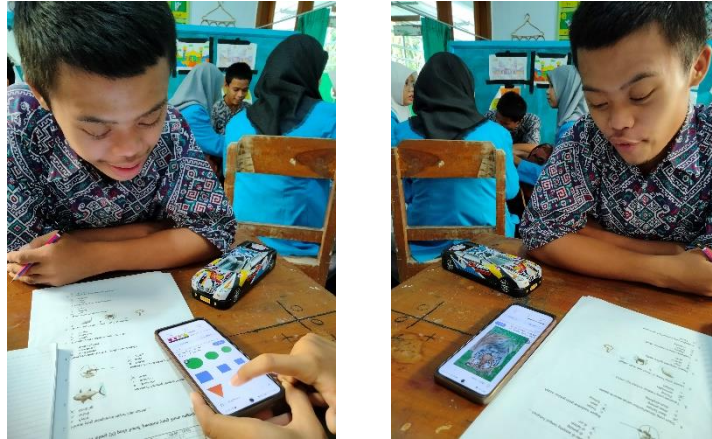
Gambar 2. Pengenalan Bangun Datar

Peneliti juga memberikan beberapa tes pengoperasian bilangan bulat kepada siswa tersebut, hasilnya anak tersebut dapat mengoperasikan penjumlahan dan pengurangan dengan baik. Akan tetapi siswa tersebut hanya mampu sampai dengan bilangan puluhan saja, untuk ratusan bahkan ribuan siswa tersebut masih kesulitan. Sebelum mengajarkan operasi penjumlahan dan pengurangan, peneliti mencoba meminta siswa tersebut untuk berhitung mulai angka 1-20, tetapi siswa tersebut hanya dapat menyelesaikan hingga perhitungan ke-10, untuk perhitungan 11-20 siswa tersebut tidak menghafalnya, namun ketika diberikan sebuah contoh angka, siswa tersebut mampu menyebutkan dengan benar sesuai contoh yang diberikan.