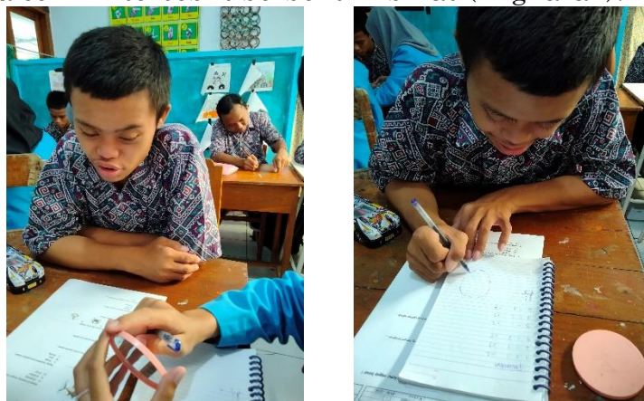
Gambar 1. Identifikasi Bentuk Lingkaran

Penggunaan media pembelajaran visual bagi anak tunagrahita harus dilakukan secara langsung dan nyata, sebagaimana yang peneliti lakukan saat memberikan pertanyaan secara spontan tentang pembelajaran matematika, bagaimana bentuk lingkaran itu ? , mereka tidak mengerti lingkaran itu yang seperti apa. Kemudian peneliti memberikan contoh konkret, dengan memberikan cermin yang berbentuk lingkaran. Kemudian ditunjukkan kepada siswa cermin tersebut, dan siswa tersebut menjelaskan bahwa cermin tersebut berbentuk bulat (lingkaran).